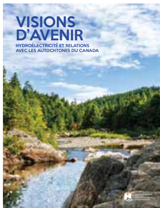
Visions d'avenir – Hydroélectricité et relations avec les Autochtones du Canada

Le groupe de travail a aussi continué de suivre et de commenter l'évolution de la gestion des GES et de leur réglementation, y compris la norme ÉcoLogo CCD-003. Il a préparé les mémoires présentés par l'ACH à l'EPA et au DOE mentionnés à la section Activités de promotion . Nos mémoires soulignaient le profil hydroélectrique du Canada et faisaient valoir les perspectives d'exportations accrues d'hydroélectricité canadienne vers les États-Unis. Le groupe de travail a aussi contribué au mémoire du Center for Climate and Energy Solutions (C2ES) sur le rôle potentiel de l'hydroélectricité canadienne dans le Clean Power Plan aux États-Unis, et en a organisé un lancement remarqué. Ce lancement visait à présenter des perspectives sur les relations canado-américaines en hydroélectricité ainsi qu'à mettre en lumière les possibilités d'aider les États-Unis à atteindre leurs cibles de réduction d'émissions de GES.