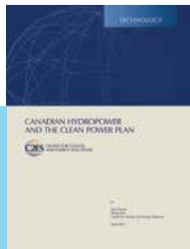
Canadian Hydropower and the Clean Power Plan

Le groupe de travail poursuit sa collaboration avec d'autres associations industrielles afin de mettre au point une stratégie d'action concernant la Loi sur les espèces en péril (LEP) après l'élection fédérale de 2015. Comme des changements législatifs semblent improbables à court terme, le groupe de travail continuera de centrer ses efforts sur l'amélioration des mécanismes d'application en consultation avec les fonctionnaires, les organisations non gouvernementales et d'autres intervenants importants dans le cadre du comité sur la LEP et par d'autres moyens.