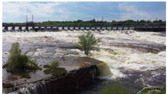
Site hydroélectrique des Chutes de la Chaudière, Energie Ottawa

Placé sous les thèmes de la réfection, de l'expansion et de la croissance, notre Forum sur l'hydroélectricité 2014 a connu une forte participation et s'est avéré instructif pour tous. Comme toujours, nous remercions chaleureusement nos commanditaires ainsi que tous les participants pour leur appui et leur présence. Les réceptions organisées dans le cadre du Forum, auxquelles ont assisté de nombreux députés, fonctionnaires, diplomates et représentants de l'industrie, ont aussi offert de bonnes occasions de réseautage.